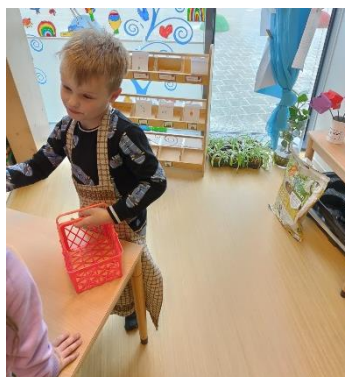
de verkoper in het tuincentrum