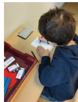
zakjes met groente- en bloemenzaden maken