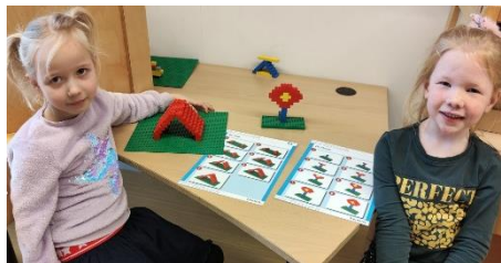
van Lego een trap en bloem maken