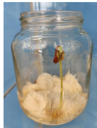
het voorlopige resultaat van de bruine bonen