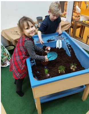
werken in de tuin

In de onderbouw zijn we deze week begonnen met ons nieuwe thema "wij werken in het tuincentrum". De kinderen zijn erg enthousiast over het thema en hebben al heel hard gewerkt. Hieronder dit keer een sfeerimpresie.